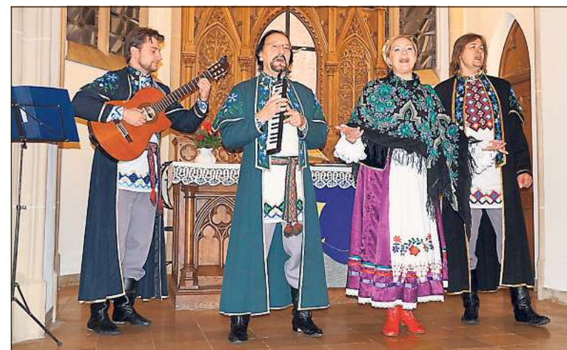
Das Gesangsensemble Kressiwa besteht seit 1991. Das Bild entstand beim Konzert im Vorjahr in der Oelder Stadtkirche.

Die Sängerin und Sänger seien Meister der klassischen und christlichen Gesangskultur. Auch russische poetisch-lyrische Romanzen sowie deutsche und russische Weihnachtslieder zählten zum Repertoire der musikalisch gut ausgebildeten Künstler, heißt es abschließend.