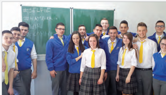
Vorbereitungstreffen für Hamburg

Mai zu einem Gegenbesuch nach Gemünden fahren. Beide Male arbeitet man am gleichen Projekt, das dann im Jahrbuch vorgestellt werden wird.