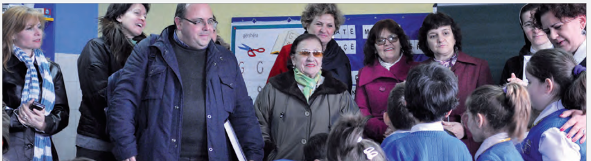
Unsere Besucher aus Shkodra in der Grundschule

Në ditën e mësuesit na vizituan katërdhjetë kolegë të gjimnazit Pjetër Meshkalla, një shkollë Jezuite në Shkodër. Pas një vizite në shkollë dhe në konvikt si dhe një vizite të shkurtër nëpër shkollën tonë fillore u takuan me kolegët tanë për të biseduar rreth shkëmbimit për të ngrënë një drekë festive. Pas drekës u organizua edhe një lojë futbollit e cila u shpague kolegëve tanë të cilët luajnë çdo javë. Në përfundim të vizitës iu bë edhe një vizitë në pjesën e vjetër të qytetit të Prizrenit.