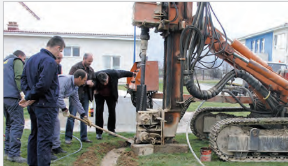
Arbeiter beim Brunnenbohren

Beim Anschluss des neuen Brunnes wurde die Gelegenheit genutzt, um auch die fehlerhaft verlegten und nicht ausreichend gekennzeichneten Anschlüsse in Ordnung zu bringen.