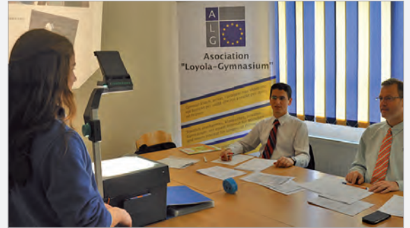
DSD Prüfung - mündlich

duan ti deshifronin shkurtesat në mbishkrimet e varrezave romake, të cilat sot ende janë një mister. Deri në dokumentimin e planifikuar për Ditën e Dyerve të Hapura kanë ende kohë t'i zgjidhin ato. Shumë sukses!