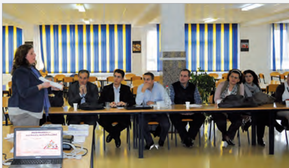
Seminar: Ignatianische Pädagogik

Kjo iu rikujtoi mësimdhënësve dhe dukatorëve në mënyrë praktike atë çka kanë mësuar më parë nga bazat e pedagogjisë, dhe falë shembujve praktik dhe ushtrimeve sigurisht ishte e dobishme.