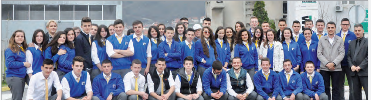
Besuch bei Sharrcem

Dass die Firmenleitung auch noch eine Pleskavica und etwas zum Trinken spendierte war eine Überraschung, für die wir uns gerne und herzlich bedanken.