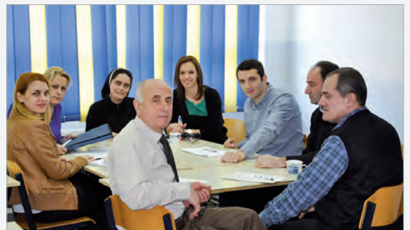
Seminar: Ignatianische Pädagogik