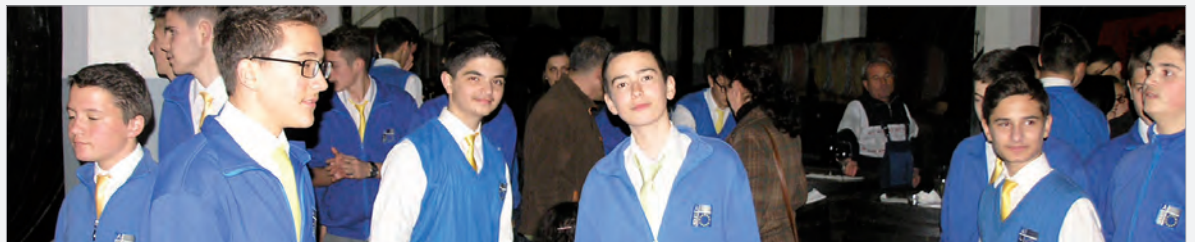
Staunende Schüler im riesigen Weinkeller

Im Rahmen des Chemieunterrichtes besuchten unsere IX. Klassen die Kellerei "Stone Castle" in Rahovec. Natürlich war es interessant zu erfahren, was es so alles braucht bis ein guter Tropfen abgefüllt werden kann.