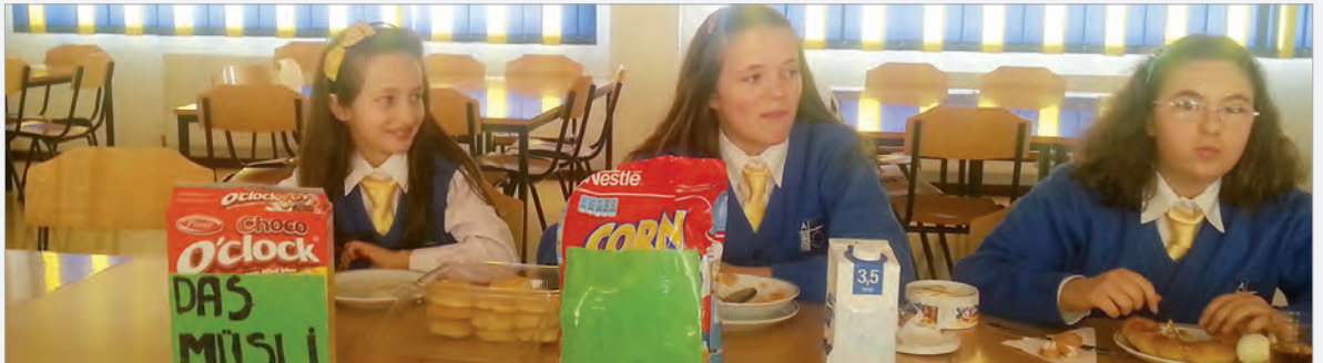
Alles was zu einem typisch deutschen Frühstück gehört - natürlich korrekt beschriftet