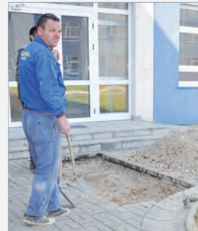
Korrektur der Wasseranschlüsse

Gjatë lidhjes së pusit të ri u shfrytëzua edhe rasti për të rregulluar edhe mjaft kyqje tjera, të cilat ishin me defekte.