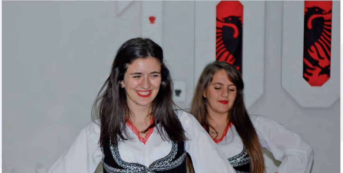
Unsere Internen feiern den 100. Jahrestag der albanischen Unabhängigkeit

Koha ishte ende e mirë kur të dielën pasdite filloi loja përfundimtare në konvikti si finalja e turnirit në futboll. Ishte njëkohësisht edhe fillimi i festimit të 100 Vjetorit të Pavarësisë së Shqipërisë.