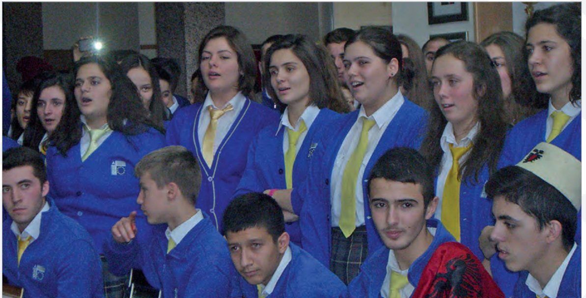
Feier der Schulfamilie zum Tag der Fahne im Foyer der Schule