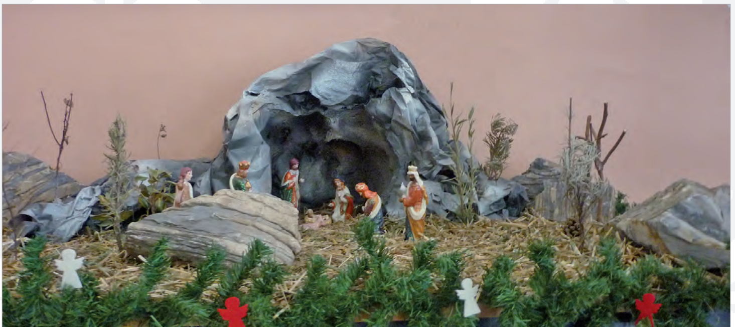
Krippe im Foyer des Loyola-Gymnasiums

Herausgeber: Association "Loyola-Gymnasium" Rr. e Tranzitit Petrovë 20000 Prizren - Kosovo P: Walter Happel SJ alg-news@alg-prizren.com www.alg-prizren.com © 2012 Association "Loyola-Gymnasium"