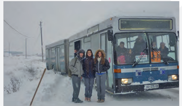
Ein Schulbus auf Abwegen

Një ndër autobusët tanë të shkollës ka rrëshqitur gjatë kthimit. Fundi i tij rrëshqiti nga rruga dhe u bllokua aty derisa një kamion e tërhoqi dhe e iu mundësua vazhdimi i sërishëm i rrugës. Fëmijët e ngazëllyer patën kënaqësi të madhe.