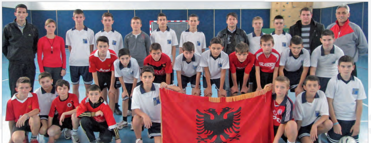
Auch beim Fußball wirft der Tag der Fahne seine Schatten voraus

Të enjten më 22.11.2012, futbollistët tanë luajtën kundër nxënësve të shkollës Hysen Terpeza nga Vitia, të cilët morën me krenari vendin e dytë. Me rëndësi ishte, që ata e ndjenin veten shumë mirë te ne. Kjo lojë miqësore sigurisht që nuk ishte e fundit sepse po planifikohet një lojë kthyes.