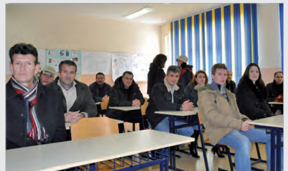
Elternnachmittag - Information der Eltern im Klassenzimmer

Pas dorëzimit të informatave të para të notave, para pushimeve, prindërit patën mundësinë të takohen me kujdestarët