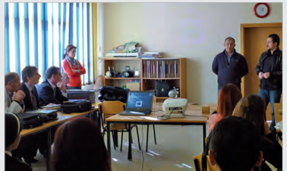
Vortrag zur Mülltrennung durch Vertreter der Bechtel Enka GP

Përfaqësues të Bechtel Enka GP, e cila është duke e ndërtuar autostradën e re në Kosovë, informuan koleget dhe kolegët tanë në një mbledhje në lidhje me mundësitë dhe përparësitë e ndarjes së mbeturinave. Kompania do të na pajisë me konteinerë dhe do të mbajë një seminar në shkollën tonë me temën "Ndarja e mbeturinave për të mbrojtur ambientin dhe resurset e tij", ku gjithashtu do të na japin përkrahje dhe këshilla.