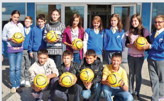
Übergabe von Fussbällen an die Schüler der Grundschule in Petrovë