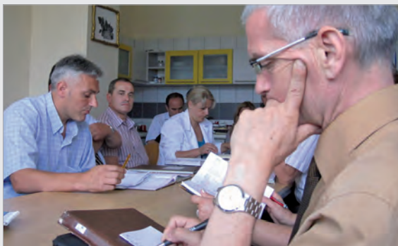
Pädagogische Konferenzen für die Mitteilungszeugnisse

Dazu setzten wir uns zwei Nachmittage zusammen und besprachen Verhalten, Leistung und Potenzial jedes Einzelnen. Zum Ende der Woche erhielten die Schüler dann die Mitteilungszeugnisse. Anschließend ging es in die einwöchigen Herbstferien.