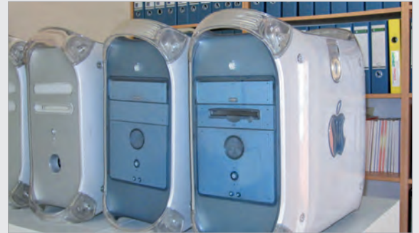
Schülerzeitung Neue/alte PowerMacs für das Redaktionsteam

Përveq njohuri've të tij ai kishte sjellë me vete kompjuterin materiale dhe pajisje për redaksinë. Ju falemnderit, ne jemi kurioz për rezultatet.