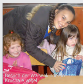
Besuch der Waisenkinder in Krusha e vogel