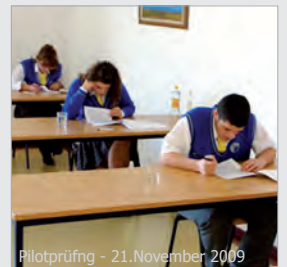
Pilotprüfung - 21. November 2009

Më 2 dhjetor përfundimisht u mbajt. Në këtë ditë profesionistët e gjuhës gjermane hynë në provimin me shkrim. Tani punimet janë në rrugë e sipër për në Gjermani, ku ato do të korrigjohen dhe notohen. Pastaj më 11.12. pasuan provimet me gojë dhe tani më duhet të pritët, deri sa në pranverë të kthehen rezultatet nga Gjermania.