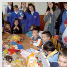
Besuch der Grundschulklasse in Velezhë