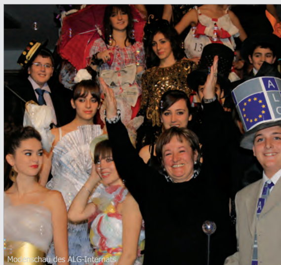
Modenschau des ALG-Internats

Ein bunter Abend mit Sketchen, mit Gesang und Tanz sowie einer etwas eigenwilligen Modenschau mit selbst entworfenen Modellen sorgte