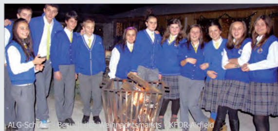
ALG-Schüler - Besuch des Weihnachtsmarkts - KFOR-Feldlager

Në kampin fushor Prizren edhe këtë vit do të ketë një kalendar të gjallë të adventit. Çdo ditë do të përgatitet një derëz e adventit në një vend tjetër të kampit. Për stacionin e parë më 01.12. disa të rinj dhe vajza tona organizuan një