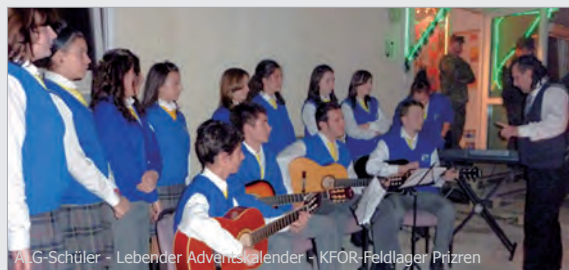
ALG-Schüler - Lebender Adventskalender - KFOR-Feldlager Prizren

Im Feldlager Prizren gibt es dieses Jahr einen lebendigen Adventskalender. Jeden Tag wird an einer anderen Stelle des