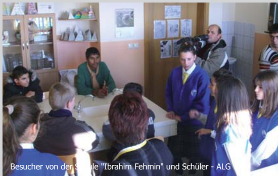
Besucher von der Schule "Ibrahim Fehmin" und Schüler - ALG

Am 20.11., dem Tag der Rechte der Kinder, besuchten