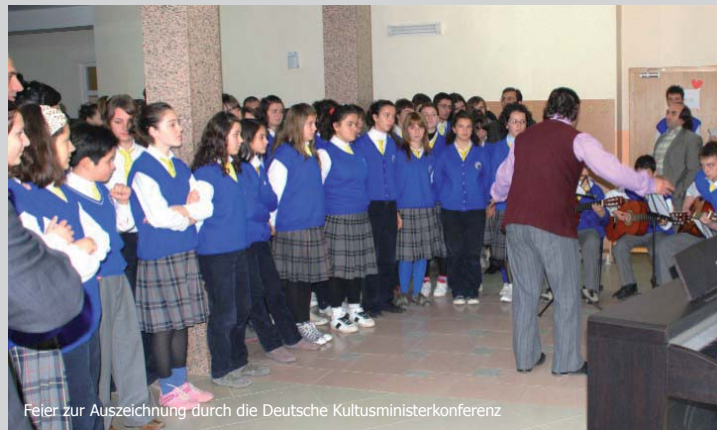
Feier zur Auszeichnung durch die Deutsche Kultusministerkonferenz

Udhëheqësi i zyrës ndërlidhëse gjermane në Prishtinë