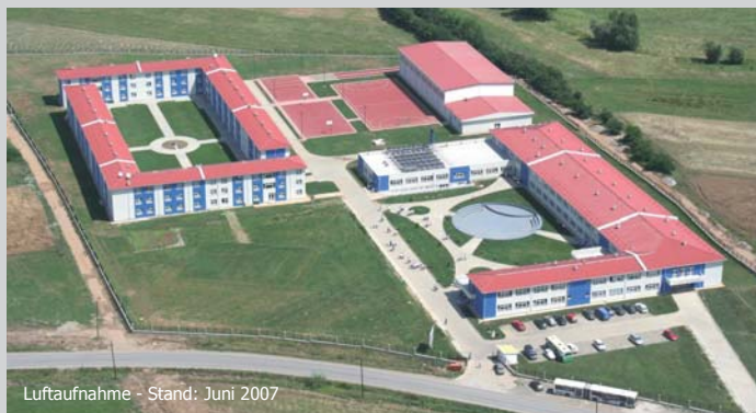
Luftaufnahme - Stand: Juni 2007

Übrigens, so sieht die Gesamtanlage jetzt aus der Vogelperspektive aus: