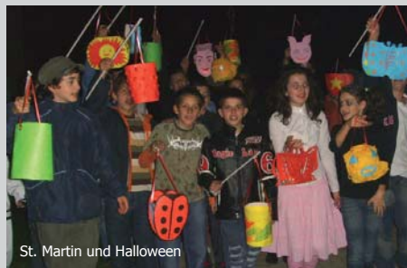
St. Martin und Halloween

Am Wochenende vor dem Martinstag feierte man hier St. Martin mit einem Umzug ums Internatsgebäude. Selbst