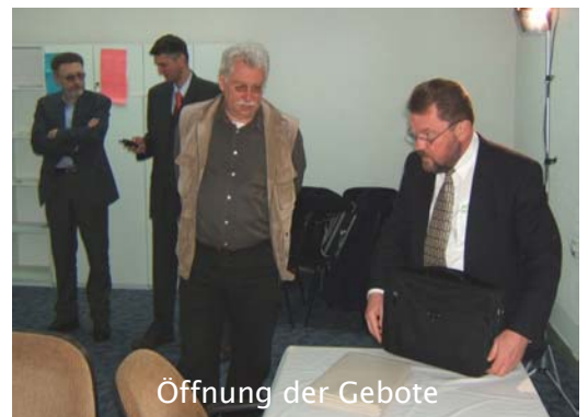
Öffnung der Gebote