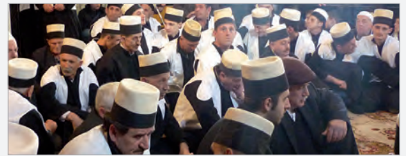
Viel gläubige Sufis hatten sich versammelt, um gemeinsam zu feiern

Me 22. Mars, bektashinjët në Shqipëri dhe në Kosovë festuan festën e Sulltan Nevruzit, e cila festohet çdo vit. Me këtë festë, me prejardhje zoroastiane, festohet fillimi i pranverës dhe fillimi i vitit të ri iranien.