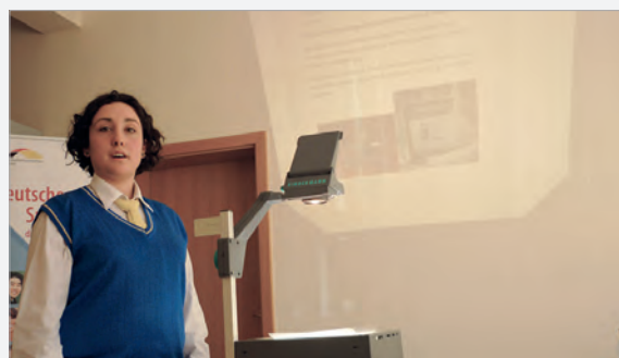
DSD mündlich: Referat zu einem selbst gewähltem Thema

Me 19. mars, u mbajt provimi me shkrim për Diplomën e Gjuhës Gjermane. Përmes Ambasadës Gjermane, u dërguan për në Gjermani të gjitha materialet për vlerësim. Rezultatet do të kthehet pastaj në kohën e vjeshtës. Provimet me gojë u mbajtën nga 20. deri më 25. mars. Tani neve na mbetet vetëm t'u urojmë shumë fat të 64 kandidatëve.