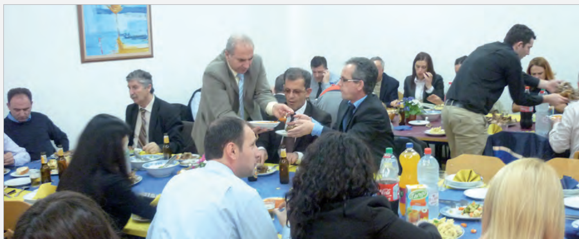
Unsere Lehrer beim gemeinsamen Mittagessen am Tag des Lehrers

Zur Mittagzeit trafen sich dann alle Lehrer zu einem gemeinsamen Mittagessen und einem gemütlichen Beisammensein im Gästepeisesaal.