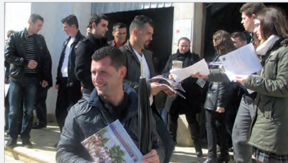
Unsere Internen informieren in Gjakova

Me 24. shkurt, konviktorët tanë vizituan famullinë e Bishtazhin në meshën e së dielës. Pas meshës ata patën mundësinë të bisedonin me njerëz, të cilët i bënin pyetje rreth jetës në konvikte dhe për shkollën. Dy javë më vonë u vizitua edhe famullia në Gjakovë, ku Françeskanët na gostitën me një Koktel.