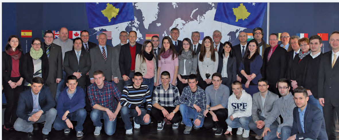
Alle Teilnehmer im Carl-Haver-Forum in Oelde

Tani ne të gjithë jemi kurioz se sa kontrata për arsim dhe praktikë do të nënshkruhen në fund të kësaj praktike.