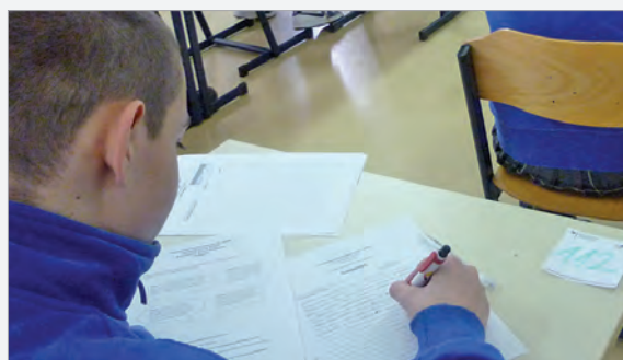
DSD schriftlich: Tapfer wird um jede Formulierung gekämpft

Am 19. März fand die schriftliche Prüfung zum Deutschen Sprachdiplom statt. Über die Deutsche Botschaft gingen die Materialien zur Auswertung dann nach Deutschland. Von dort wird im Laufe des Herbstes dann das Ergebnis kommen. Die mündlichen Prüfungen wurden vom 20. Bis 25. März einschließlich durchgeführt. Jetzt bleibt uns nur den 64 Kandidaten die Daumen zu drücken.