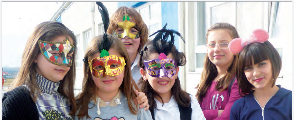
Bei aller Skepsis – Karneval muss sein!

150 Euro. Nxënësit vendosën, që me atë shumë ata të blenin gjëra ushqimore dhe ato t'i shpërndanin në familje skamnore. Një ide shumë e mirë! I falenderojmë dhe i përgëzojmë!