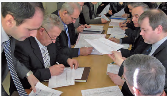
Bei den Konferenzen wird jeder einzelne Schüler besprochen

Die Ausgabe der Zeugnisse war am 1. Februar. Insgesamt, von wenigen Ausnahmen abgesehen, kann man mit den Ergebnissen zufrieden sein.