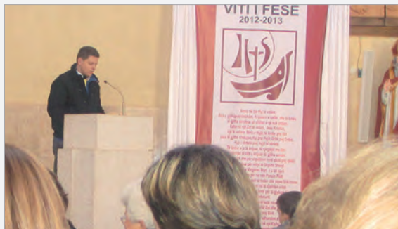
Unsere Internen informieren in Zym über das Loyola-Gymnasium

An den Internatswochenenden fahren unsere katholischen Schüler gewöhnlich mit dem Bus in die Stadt zum sonntäglichen Gottesdienst. Das war an diesem Sonntag anders. Diesmal ging es in voller Schuluniform per Bus nach Zym, um den Sonntagsgottesdienst dort mit zu gestalten. Vom Pfarrer