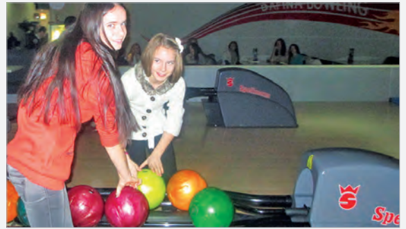
Unsere Mädchen beim Bowling

Të dielën grupi i vajzave të konviktit shkuan në Bowling në qytet. Për shumë veta kjo ishte hera e parë. Ndërsa rrokullsinin topat ishte shumë argëtuese, por për një kampionat sigurisht që ende nuk ishte e mjaftueshme.