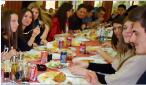
Gemeinsames Essen der Klasse XII d