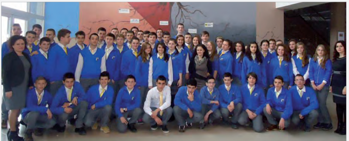
Vor dem Stadtausflug versammelten sich die IX-ten Klassen mit ihren Lehrerinnen in der Aula der Schule zum Gruppenfoto

Grupit të organizatorëve të ahengut u kishin mbetur tepriçë