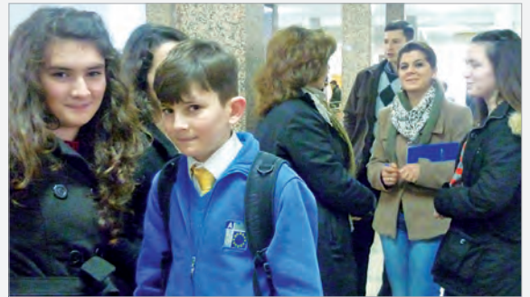
Zweifel: Was erfahren meine Eltern wohl jetzt?

150 Euro blieben der Gruppe, die die Party organisiert hatte, am Ende noch übrig. Die Schüler haben sich entschlossen