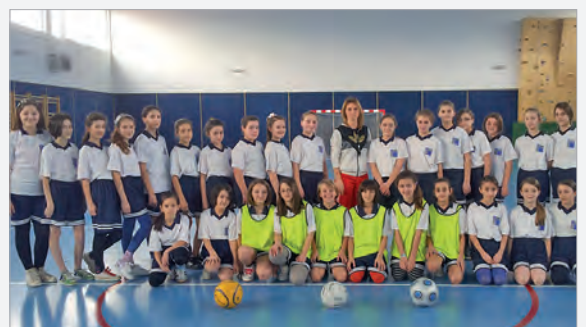
So sehen siegreiche Fussballerinnen aus