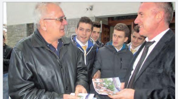
Interne und Erzieher im Gespräch mit Gottesdienstbesuchern in Zym

Të mirëpritur ngrohtësisht dhe të përshëndetur për zemërsisht nga prifti, në përmbyllje të meshës së shenjtë, nxënësit u treguan atyre për jetën në konvikti dhe në shkollë. Me 24 shkurt, do të organizohet diçka e ngjashme në famullinë në Bishtazhin.