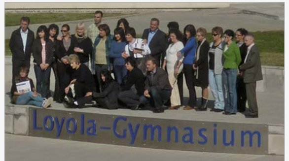
Schulleiter aus Sliven

Me 20 tetor, na vizitoi një grup i udhëheqësve të shkollave nga Sliven. Të ftuar nga qyteti i Prizrenit, ata shfrytëzuan mundësinë të vizitojnë shkollën dhe konviktin dhe të informohen për punën që bëjmë. Me kafe dhe ëmbëlsira në lokalet e menzes ata zhvilluan bisedime të ngrohta dhe shkëmbyen ide dhe opinione të shumta.