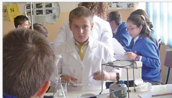
"Entdeckendes Lernen" im Chemielabor erfordert höchste Konzentration

Këto pyetje u interesonin nxënësve tanë të klasave të shtata. Mësuesja jonë e kimisë përdori këto pyetje, të cilat ishin në