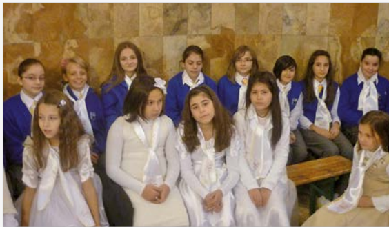
Jubiläumsfeier in der Kathedrale von Prizren