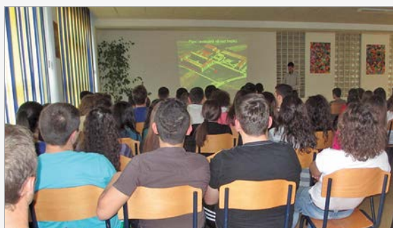
Einweisung der Schüler in den Evakuierungsplan