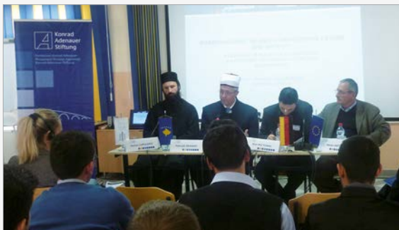
Orthodoxe, muslimische und katholische Vertreter auf dem Podium

Mehr als 80 Teilnehmer aus Makedonien und Kosovo, Muslime, Orthodoxe und Katholiken arbeiteten zu diesem Thema in Diskussionen, Workshops und Gesprächen. Vertreter des Staates und der Religionsgemeinschaften leiteten dazu an. Ergänzt wurde das Seminar durch geführte Besuche von Moscheen und Kirchen.