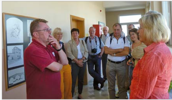
Delegation vom Rotary Club Bensheim-Heppenheim

Rotarier von der Bergstraße besuchten das Loyola-Gymnasium am 29. September. Es war für sie nicht nur von großem Interesse, etwas über die Schule und das Internat zu erfahren, sondern sie interessierten sich auch sehr für die Gesamtsituation des Landes. Jetzt planen Sie, unseren Stipendienfond zu unterstützen.