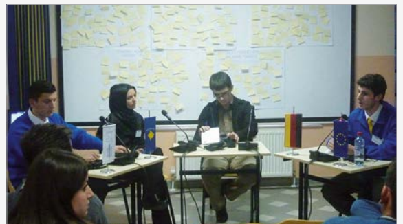
Rollenspiel: Wie kann Dialog gelingen?

Më shumë se 80 pjesëmarrës musliman, ortodoks dhe të krishterë nga Maqedonia dhe Kosova, bashkëpunuan në këtë temë me diskutime, seminare dhe biseda. Me këtë rast ligjëruan përfaqësues të shtetit dhe të shoqërive fetare. Seminarin e përcollën edhe vizitat në xhamia dhe kisha.