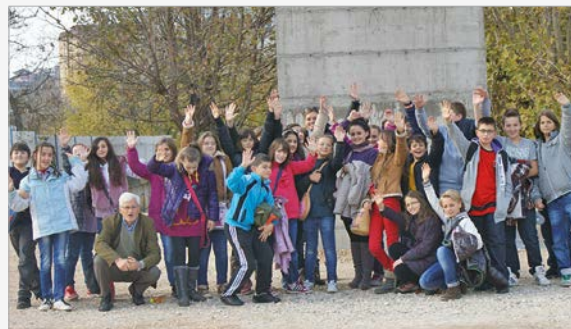
Unsere VI a auf dem Skenderbegplatz in Pristina