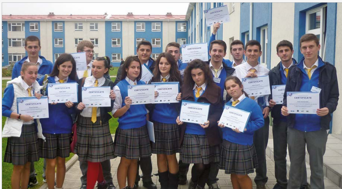
Eine Urkunde dokumentiert die erfolgreiche Teilnahme am Seminar

Liebe Freunde, im Rückblick ist es immer wieder eine Überraschung zu sehen, was sich bei uns so alles ereignet hat. Dankbar müssen wir sein, dass viel und vor allem viel Gutes und Interessantes geschehen ist.