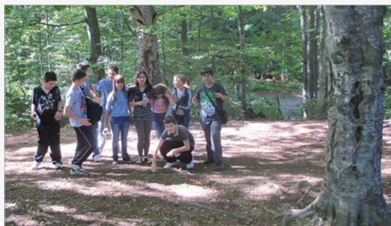
Ausflug unserer Internen ins Prevalla-Tal

Kështu përveç specialiteteve të reja u përgatit edhe pogaçja tradicionale, një bukë tipike tradicionale. E gatuar vet, thjeshtë shijon më shumë.