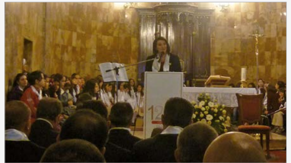
A. Jahjaga, Präsidentin der Republik Kosovo, hält die Festrede