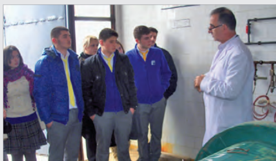
Lebendiger Chemiunterricht: Wie arbeitet eine Kläranlage?

Herzlichen Dank an die gesamte Abteilung, die uns gerne immer wieder willkommen heißt.