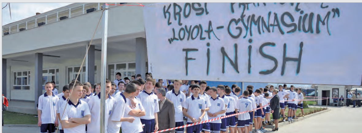
Laufen für den Frühling