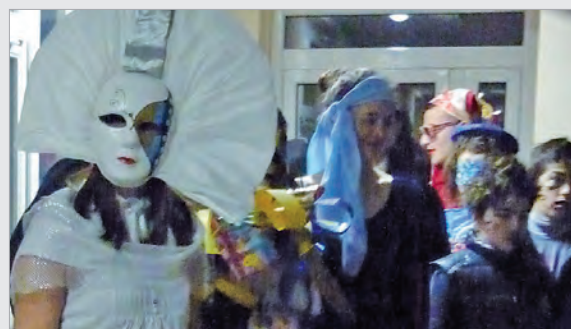
Ein Hauch von Venedig

Pas shkrirjes së borës, shumëqka që ishte mbuluar, u duk përsëri. Ishte arsye e mjaftueshme të bëhet një pastrim pranveror. Këtë e bën nxënësit tanë në një pasdite me diell.