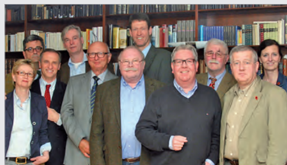
Gründungsmitglieder des Fördervereins