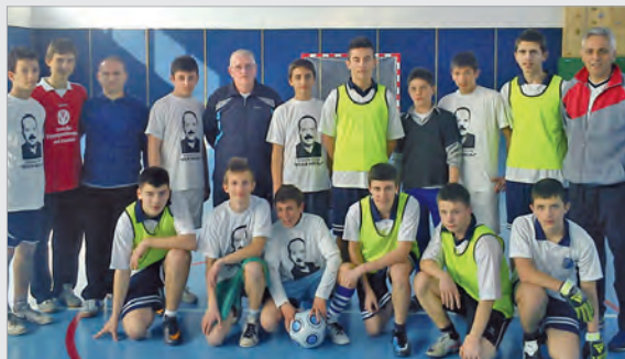
Unsere siegreichen Fussballer