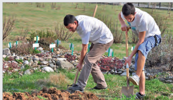
"Frühjahrsputz" im Schulgarten