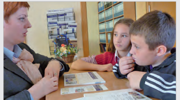
Anmeldung für das kommende Schuljahr in der Verwaltung

Për vitin e ri shkollor ne llogarisim sërish shumë regjistrime të reja; por ne nuk kemi klasë të mjaftueshme. Kështuqë, deponë, infirmjerinë dhe sallën e takimeve me prind, i kemi bartur, në benesën e shtëpiakut të shkollës. Hapësira e fituar do të transformohet, dhe kështu do të krijohen dy klasë të reja.