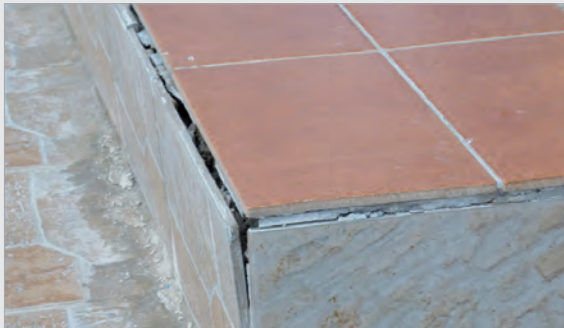
Vom starken Frost abgesprengte Fliesen

Da sie zudem eine gefährliche Ausrutschfalle darstellten, haben wir uns entschlossen, alle Eingangsbereiche mit neuen, rutschsicheren Platten neu zu gestalten. Bis zum Schulfest ist dann wohl alles neu.