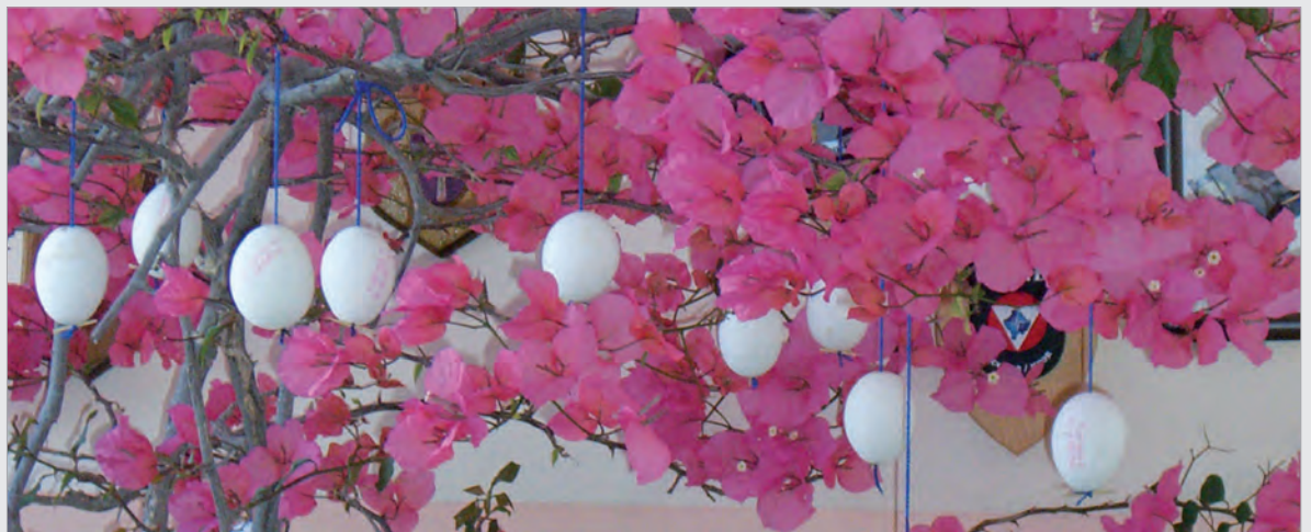
Überall in der Schule und in den Internaten kann man Ostereier finden