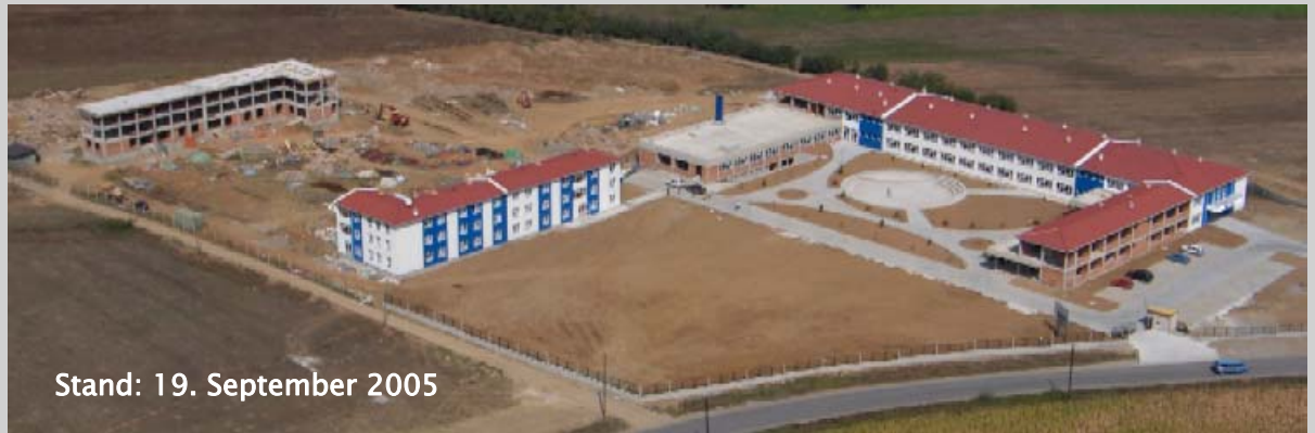
Stand: 19. September 2005

sind dankbar, dass dieses kleine Wunder möglich wurde. Zu danken haben wir ganz sicher Ihnen, die Sie dieses Wunder mit ermöglicht haben. Nicht zuletzt auch der Firma